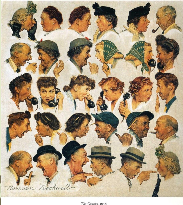
The Gossips, 1948